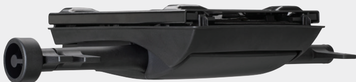
LISTO 153x150 mm senza regolazione